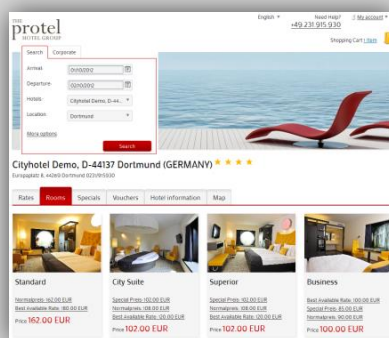
Выбор номера так же прост, как совершение покупки в магазине